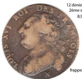
12 deniers 1792 N 2ème semestre 8,94 gr.