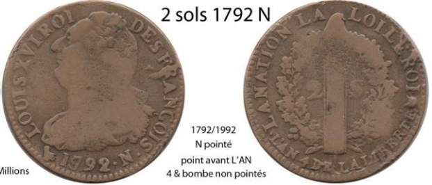
2 sols 1792 N

1792/1992 N pointé point avant L'AN 4 & bombe non pointés