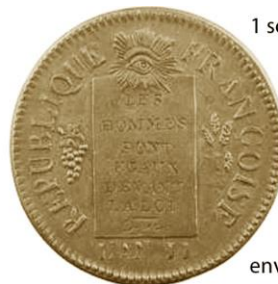
1 sol AN II N