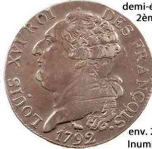
demi-écu 1792 N 2ème sem.