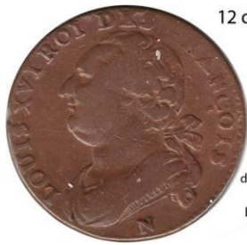
12 deniers 1792 N 1er sem. 11,62 gr.

différent Directeur Oiseau/Arc bombe à gauche