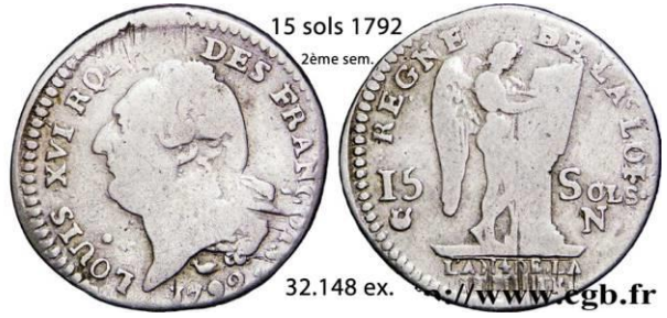
15 sols 1792 2ème sem.