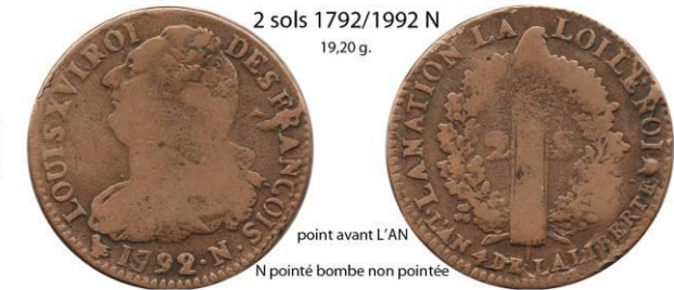
2 sols 1792/1992 N 19,20 g.

point avant L'AN point avant 1792 N & bombe pointés