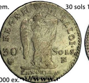
30 sols 1792