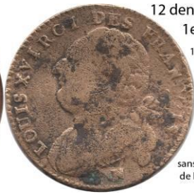
12 deniers 1792 N 1er sem. 10,72 gr.