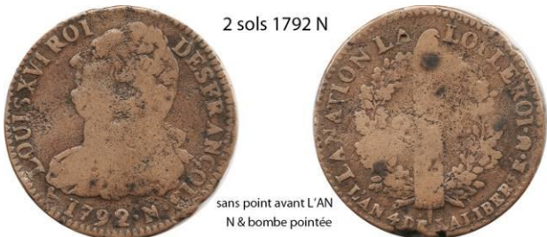
2 sols 1792 N

1792/1992 N pointé point avant L'AN 4 & bombe non pointés