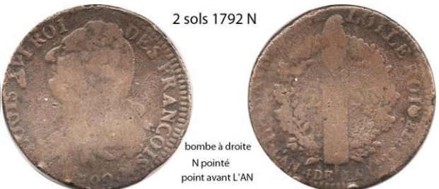
2 sols 1792 N

bombe à droite N pointé point avant L'AN