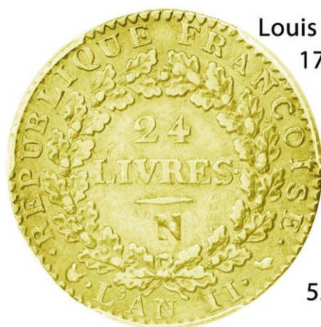
Louis 24 livres 1793 N