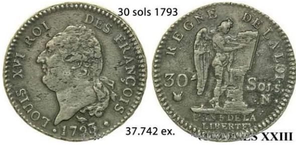
30 sols 1793