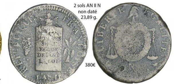
2 sols AN II N non daté 23,89 g.