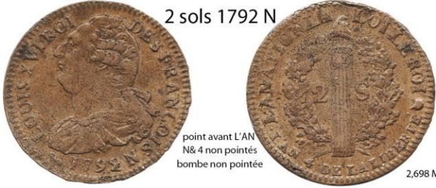
2 sols 1792 N

point avant L'AN N & 4 non pointés bombe non pointée