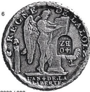
UBS Janvier 2003 / 682