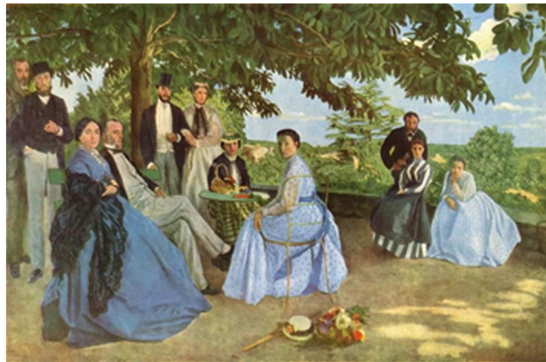
Frédéric Bazille : « La robe rose » et « La réunion familiale » (Musée d'Orsay)

Au combat de Beaune-la-Rolande du 28 novembre 1870, disparaissait, à l'âge de vingt-huit ans, le peintre Frédéric Bazille, membre du groupe des « Impressionnistes ». Depuis 1862, sous la houlette du peintre Charles Gleyre, ce groupe de peintres essayait sans grand succès de promouvoir un nouveau style de peinture. Bazille et Cézanne plus fortunés que les autres (Degas, Renoir, Sisley, Manet, Berthe Morisot, Pissarro ...) fournissaient l'intendance.