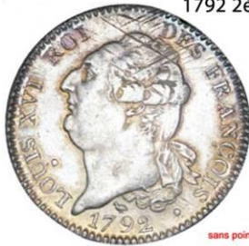
1792 2ème sem.