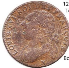
12 deniers 1792 N 1er semestre 11,82 gr.