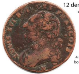
12 deniers 1792 N cuivre