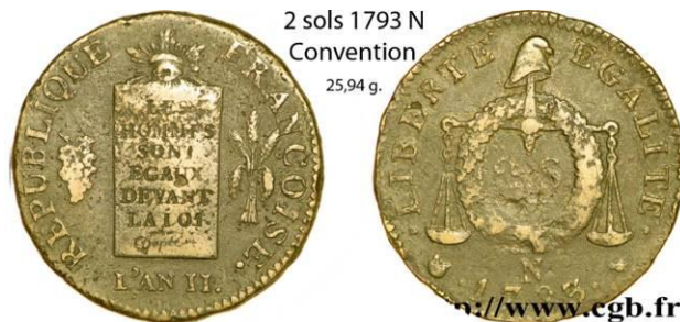
2 sols 1793 N Convention 25,94 g.