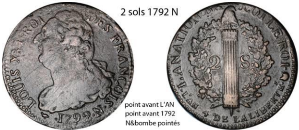
2 sols 1792 N

bombe à droite N pointé point avant L'AN