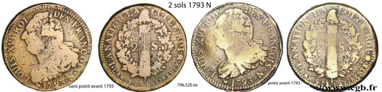
2 sols 1793 N

point avant L'AN N pointé bombe non pointée