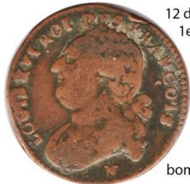
12 deniers 1792 1er semestre 13,12 gr.